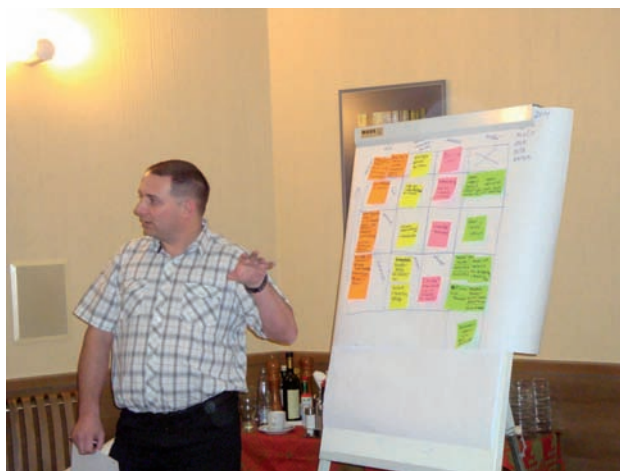
Školení projektového řízení v Broumově