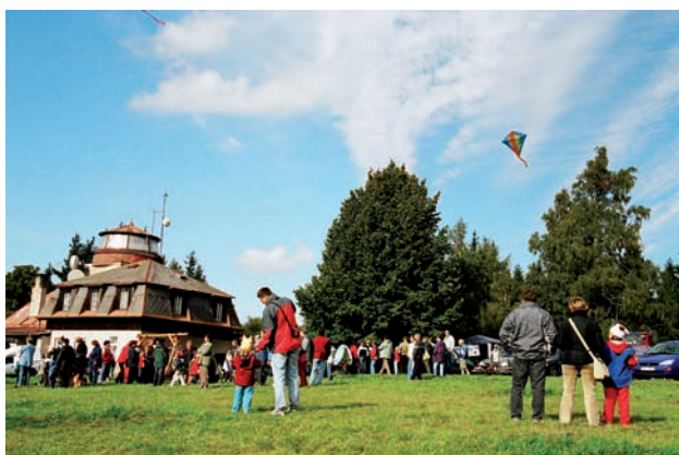
Podzvičinsko – Zavírání sezóny

Dosud byl vytvořen nový grafický manuál včetně nového loga, které je symbolem pro krajinu Podkrkonoší s krásnou přírodou bohatou na faunu a floru. Dále probíhají práce na přípravě ostatních propagačních materiálů. Ukončení projektu je naplánováno na červen 2013.