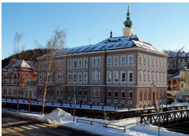
Zateplení budovy Obchodní akademie Trutnov

Financování těchto opatření je realizováno z větší části z Fondu soudržnosti Evropské unie, dále pak z finančních prostředků Státního fondu životního prostředí ČR a kofinancováno žadatelem.