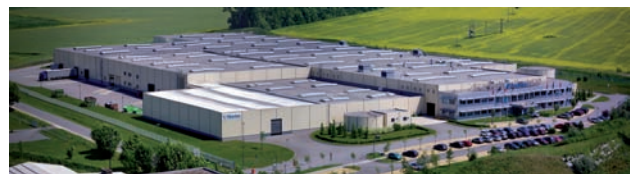
Areál společnosti Fibertex, a.s.