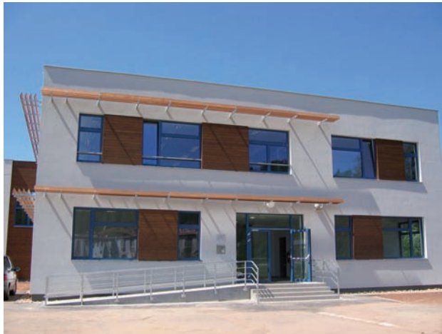
COV v lesnictví Trutnov

V pořadí 4. projekt COV bude dokončen v průběhu roku 2012: