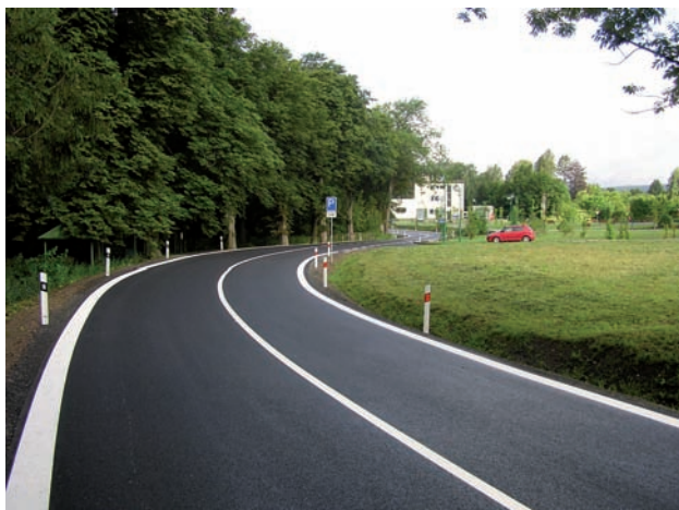
Zrekonstruovaná komunikace v rámci projektu II/284 Brdík – Tetín – Vidoň

Koncem roku 2011 Rada Královéhradeckého kraje schválila přípravu dalších 10 projektů, které budou o evropskou dotaci žádat ve výzvě ROP SV vyhlášené v roce 2012.