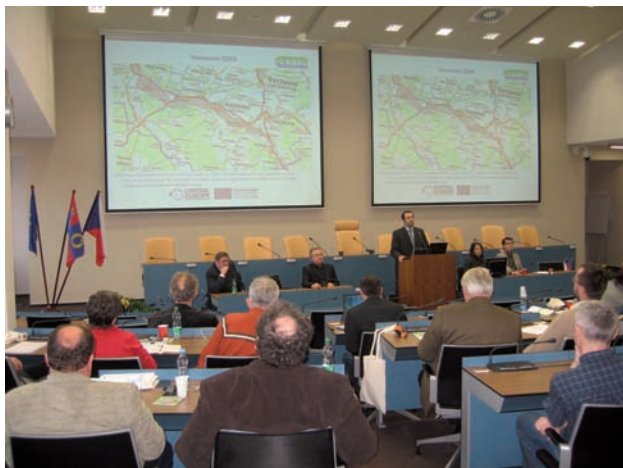
Prezentace pilotní studie LABEL seminář Královéhradeckého kraje

V rámci studie bylo provedeno zpracování veškerých dostupných informací o historických povodních, vytvořena aplikace Povodňové značky historických povodní, dokončena identifikace nebezpečných objektů, byly zmapovány a popsány objekty nacházející se v jednotlivých úrovních n-letých vod.