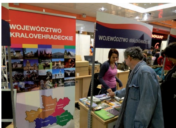
Prezentace Královéhradeckého kraje ve Vratislavi

Během roku 2011 byl také vybrán dodavatel na zajištění statistických šetření za účelem zmapování portfolia turistů přijíždějících do Královéhradeckého kraje nad rámec údajů poskytovaných Českým statistickým úřadem. Závěrečná zpráva, kterou kraj získá, povede k zavedení adekvátních opatření směřujících ke zlepšení současné infrastruktury a poskytovaných služeb a k vytvoření požadované turistické nabídky pro jednotlivé cílové skupiny. Mezi další aktivity projektu patří např. vytvoření datového skladu, realizace výstavních systémů pro prezentaci života a díla Františka Kupky aj. Projekt bude ukončen v roce 2013.