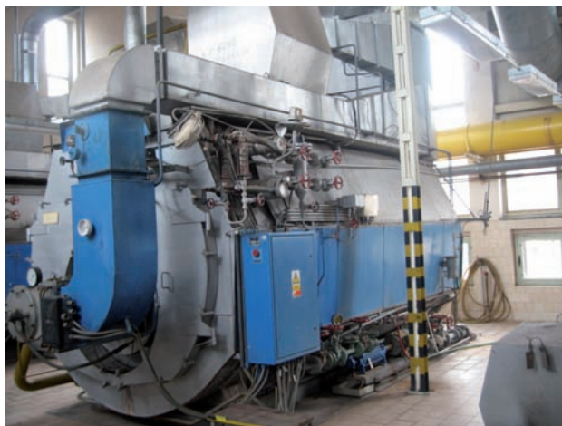
Starý kotel v nemocnici Jičín

Navrhovaná opatření jsou financována z větší části z Fondu soudržnosti Evropské unie, dále pak z finančních prostředků Státního fondu životního prostředí ČR a kofinancováno žadatelem.