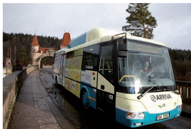
Nový autobus společnosti OSNADO

Provozovaná trasa turistické linky v zimní sezoně vede od vybraných lyžařských destinací ve východní části Krkonoš (Jánské Lázně, Svoboda nad Úpou, Mladé Buky) za dalšími atraktivitami cestovního ruchu v regionu. Od dubna 2012 naváže na zimní provoz letní podoba této linky propojující významné cíle, jakými jsou ZOO ve Dvoře Králové nad Labem, zámek Hospitál Kuks s přehradou Les Království.