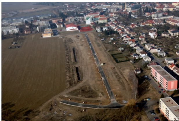
Pozemek pro výstavbu rodinných domků pro projekt Transformace ÚSP pro tělesně postižené v Hořicích v Podkrkonoší - výstavba v lokalitě Hořice

V rámci projektů předkládaných do Integrovaného operačního programu budou prováděny především stavební úpravy, nebo výstavba a vybavení objektů určených pro bydlení a návazné sociální služby tak, aby splňovaly tyto objekty specifické podmínky pro lidi s postižením.