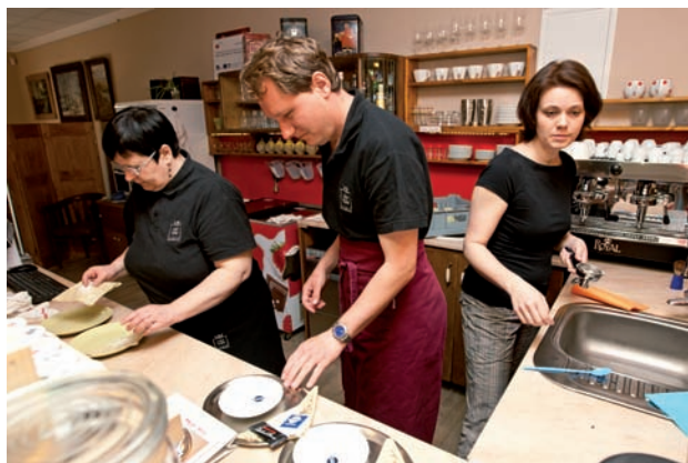
Kavárna Láry Fáry v Náchodě

Během realizace projektu, který probíhá od roku 2008 a bude ukončen v roce 2012, již bylo podpořeno 9030 klientů.