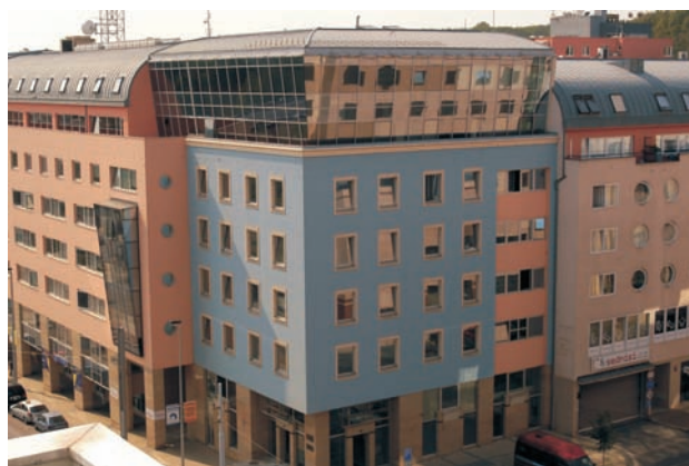
Český telekomunikační úřad

V současné době probíhá v Českém telekomunikačním úřadu několik projektů, jeden z nich se snaží zmapovat probíhající procesy v Úřadu a navrhnout optimální řešení fungování Úřadu. Řeč je o „Efektivní správě Českého telekomunikačního úřadu“. Cílem projektu je zajištění větší efektivity a transparentnosti výkonu státní správy Českého telekomunikačního úřadu (dále jen Úřad), snížení