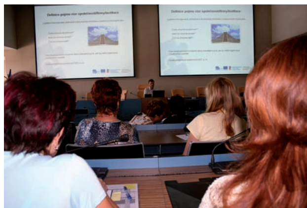
Prezentace výstupů zaměstnancům krajského úřadu

Celkem bylo zatím v projektu podpořeno 463 osob a 231 úspěšných absolventů kurzů.