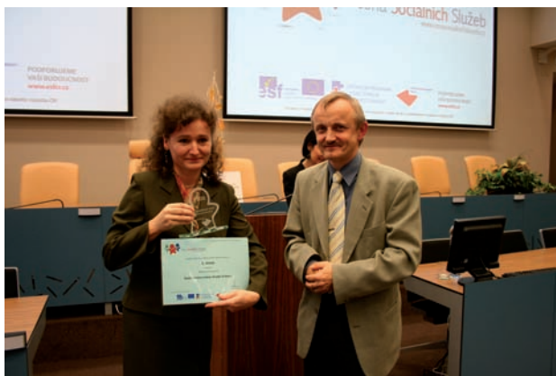
Cena sociálních služeb

Kromě řízení a administrace projektu je Centrum EP zapojeno přímo do realizace zajištěním individuálních a dlouhodobých konzultací pro poskytovatele sociálních služeb (230 konzultací) a organizací seminářů a tvůrčích dílen, které umožňují sdílení informací a zkušeností mezi zadavateli a poskytovateli (57 seminářů).