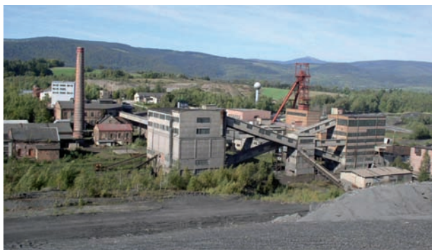
Pohled na areál Dolu Jan Šverma - budova úpravny uhlí, dopravní mosty a budova zásobníků uhlí.

Hlavním přínosem projektu je odvrácení havarijního stavu objektů v areálu Dolu Jan Šverma, které jsou kulturním dědictvím regionu, a zpřístupnění skanzenu turistům v zájmu zvýšení povědomí o hornictví a technických památkách.