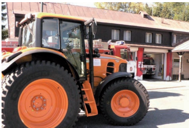
Nové vybavení hasičů ve Špindlerově Mlýně

Dále bude v letech 2012 a 2013 na obou stranách hranice vybudován kamerový dohledový systém, budou uskutečněny dva půlroční jazykové kurzy polštiny pro české hasiče (a češtiny pro polské hasiče), na konci každého kurzu bude uspořádáno jedno společné 1denní školení. Dále budou v letech 2012 a 2013 realizována dvě společná hasičská cvičení.