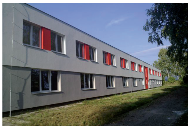
Výrobní hala společnosti Matrix a.s.

Hlavním přínosem projektu je zajištění kompletní realizace výroby oken a dveří, kvality a ekologické výroby. Dalším přínosem je zvýšení cenové a časové efektivity.