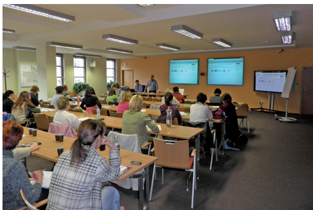
Školení k benchmarkingové aplikaci