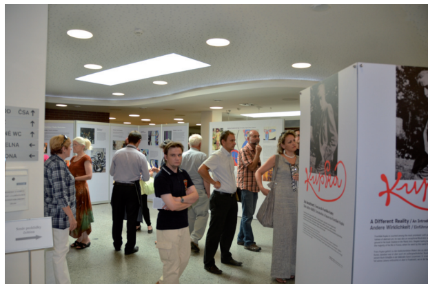
Prezentační akce Život a dílo Františka Kupky