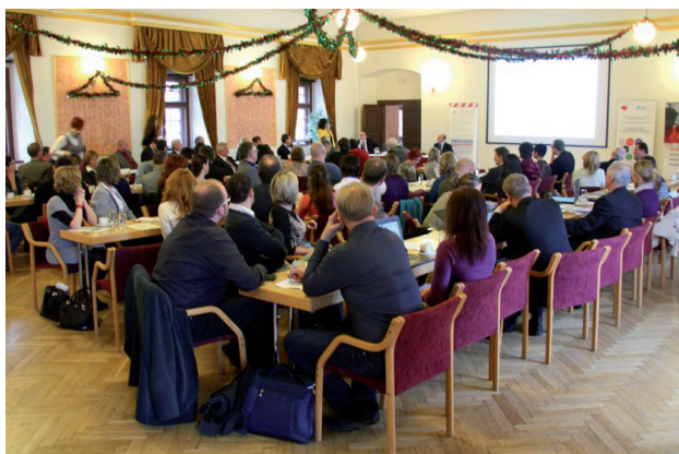
1. Fórum investic, výzkumu a inovací

Centrum EP společně s dalšími partnery uspořádalo 1. Fórum investic, výzkumu a inovací. Hlavním tématem konference byl aktuální stav přípravy ČR na nové programové období EU 2014 – 2020 s důrazem na výzkum, vzdělávání, podnikání a inovace.