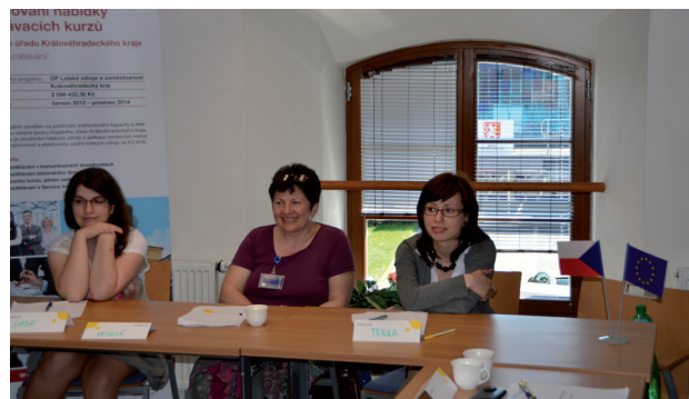
Vzdělávací kurz Komunikace s veřejností

V návaznosti na absolvované kurzy budou lektorským týmem vytvořeny vlastní vzdělávací programy, které budou akreditovány.