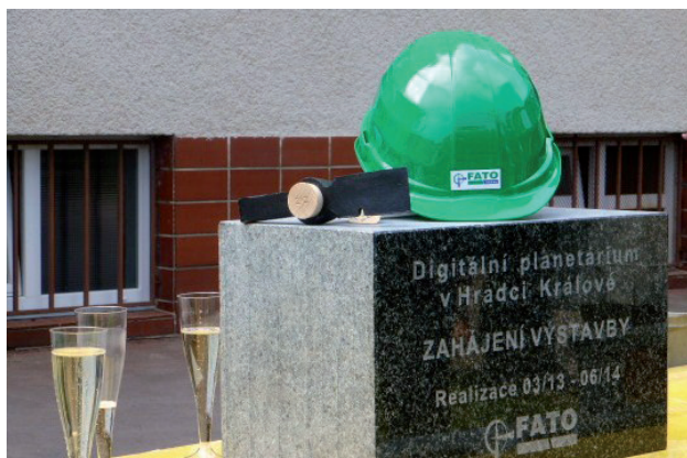
Digitální planetárium Hradec Králové

Obsahem projektu je vybudování nového objektu digitálního planetária, které bude sloužit jako návštěvnické centrum pro propagaci a informovanost o výsledcích vědy a výzkumu.