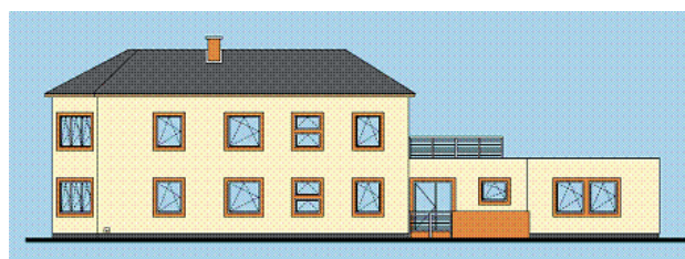
Vizualizace rekonstrukce objektu v lokalitě Plotičtět nad Labem

V rámci projektů předkládaných do Integrovaného operačního programu budou prováděny především stavební úpravy nebo výstavba a vybavení objektů určených pro bydlení a návazné sociální služby tak, aby splňovaly tyto objekty specifické podmínky pro osoby s postižením.