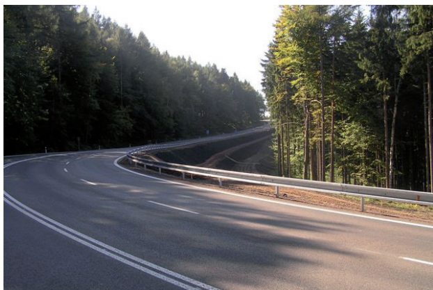
Komunikace na vrchol Pasa se dočkala rekonstrukce a rozšíření o stoupací pruh

Přípravu a realizaci projektů v oblasti rozvoje regionální silniční infrastruktury zajišťuje Centrum EP ve spolupráci se SÚS Královéhradeckého kraje, a.s., a Odborem dopravy a silničního hospodářství Krajského úřadu Královéhradeckého kraje.