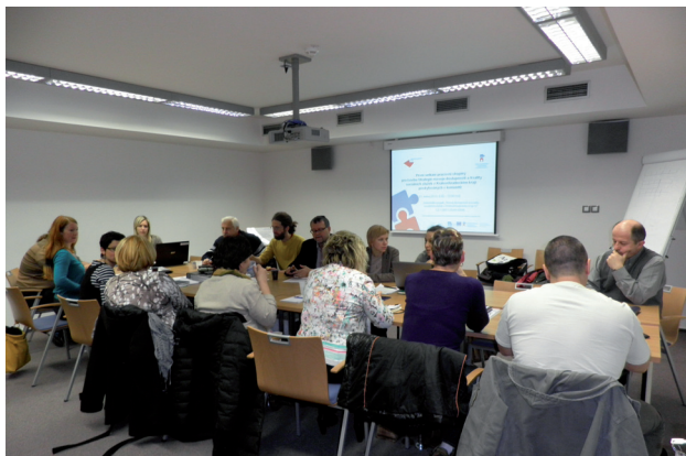
Pracovní skupina pro tvorbu strategie