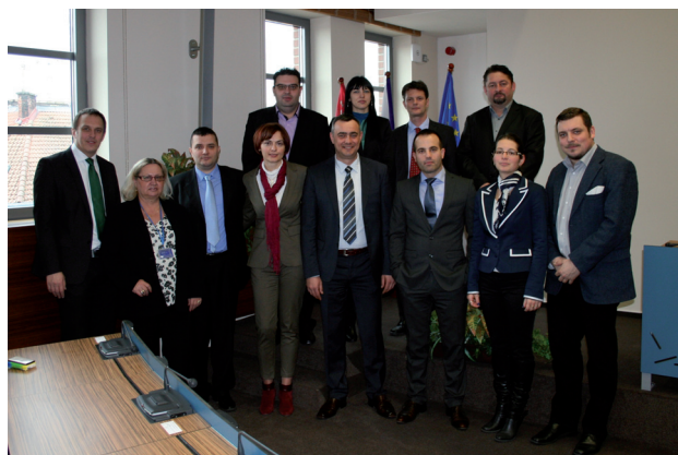
Koordinační jednání s partnerskými organizacemi ze Srbska

Cílem projektu bylo seznámení partnerů na obou stranách a vzájemné zprostředkování informací důležitých pro budoucí spolupráci, sdílení zkušeností s ekonomickou a společenskou transformací, posilování kapacit pro kvalitní správu veřejných věcí a přenos zkušeností s čerpáním prostředků z programů EU.