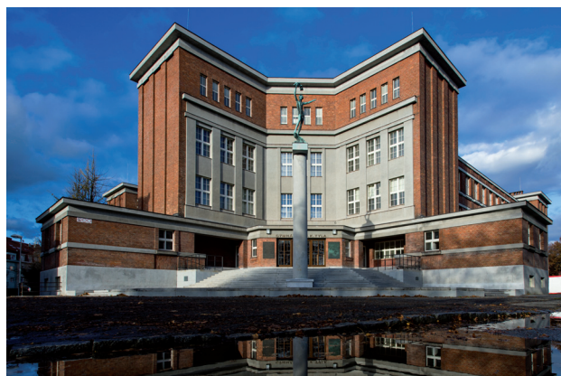
Gymnázium J. K. Tyla

Záměrem projektu je rekonstrukce stávajícího objektu Gymnázia J. K. Tyla v Hradci Králové. Rekonstrukce se týká všech částí areálu.