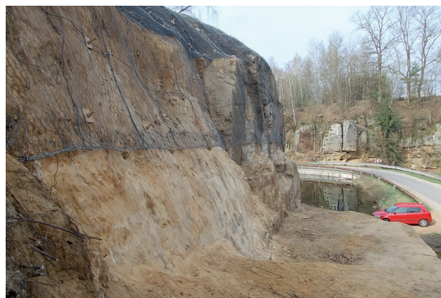
Stabilizace svahu v Rovni

Tato opatření jsou v celkové očekávané částce cca 36 mil. Kč a převážná část nákladů bude kryta dotací z Evropského fondu pro regionální rozvoj, konkrétně z Operačního programu Životní prostředí.