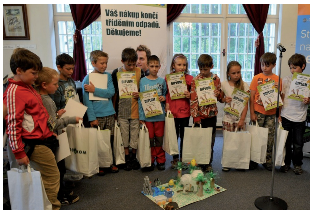
Vyhlášení výsledků soutěže škol „Třídíme s Nikitou“

pojena společnost ASEKOL s.r.o. a v loňském roce mezi partnery projektu vstoupila společnost ELEKTROWIN a.s. Projekt se věnuje zkvalitnění nakládání s odpady v Královéhradeckém kraji a podporuje správné třídění odpadů informační kampaní. Technická podpora nakládání s odpady je zajišťována nákupem nádob na třídění odpadů do obcí, do škol a také realizací investičních projektů v oblasti odpadového hospodářství, které řeší zejména rozvoj infrastruktury sběru komunálního odpadu. Mezi cíle projektu patří i vzdělávání a osvěta zástupců obcí kraje, několik let probíhají i vzdělávací programy pro školy s tematikou třídění odpadů a realizují se mnohé další regionální komunikační aktivity. Součástí informační kampaně je uveřejnění inzerátů, zpracování odborných článků, vysílání spotových kampaní v rozhlasu, pořádání soutěží pro veřejnost, organizace soutěže obcí a škol, podpora akcí pro veřejnost a další. Veškeré aktivity projektu jsou zaměřeny na problematiku třídění a recyklace odpadů.