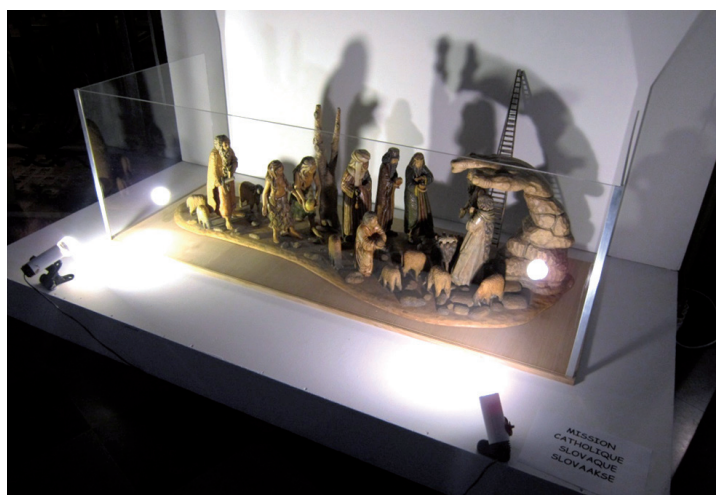
Prezentace českého betlému v Bruselu