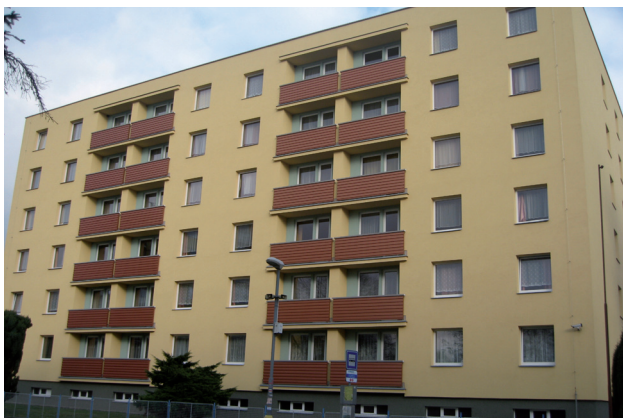
Zateplení SŠIS Dvůr Králové n.L. – internát

Financování výše uvedených opatření je z větší části poskytnuto z prostředků Evropské unie (Fond soudržnosti), dále pak z finančních prostředků Státního fondu životního prostředí ČR a kofinancováno žadatelem.