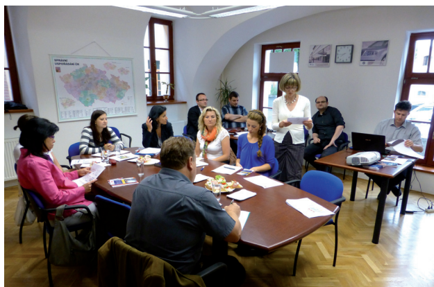
Setkání pracovníků obcí s rozšířenou působností