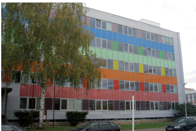
Zateplení SUPŠ HNN Hradec Králové

Centrum EP se zabývá činnostmi ve všech fázích celého procesu, tzn. přípravou žádosti o dotaci, řízením realizace (organizace výběrových řízení, komunikace se zprostředkovatelem dotace Státním fondem životního prostředí ČR, řízení rozpočtu akce atd.) a udržitelností projektů (po období 5 let od ukončení realizace). Mezi úspěšně ukončené projekty v roce 2013 patří např. zateplení budov a výměna výplní školských zařízení SŠTŘ Nový Bydžov, SPŠ Nové Město nad Metují, SŠ, ZŠ a MŠ Štefánikova Hradec Králové, SUPŠ HNN Hradec Králové, Gymnázium Rychnov nad Kněžnou, VOŠ a SŠ Zdravotnická Hradec Králové, OU a PŠ Hořice.