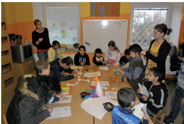
Práce s dětmi v sociálně aktivizační službě