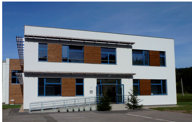
Centrum odborného vzdělávání v lesnictví – SPŠ Trutnov