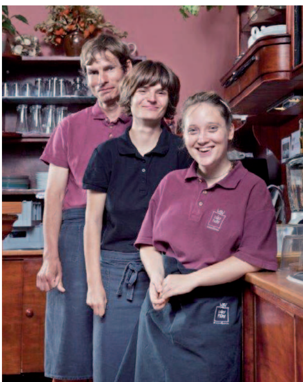
Sociální rehabilitace – kavárna Láry Fáry

Dvaadvacet služeb sociální prevence v Královéhradeckém kraji využilo po dobu dvou let podpory projektu Služby sociální prevence v Královéhradeckém kraji II, který se zaměřil na poskytování vybraných služeb dle zákona č. 108/2006 Sb., o sociálních službách. Díky projektu tak sociální služby poskytly pomoc 2 888 klientům a přispěly tak k jejich integraci do ekonomického, sociálního a kulturního života společnosti. Projekt podpořil 13 organizací, které služby sociální prevence v Královéhradeckém kraji zajišťují.