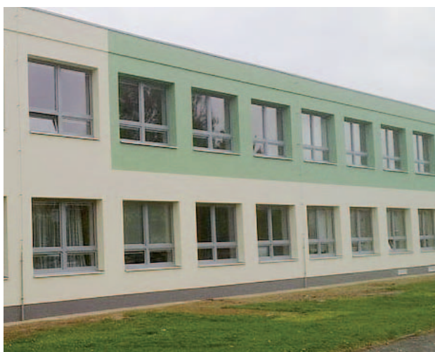
VOŠ, SOŠ a SOU Kostelec nad Orlicí