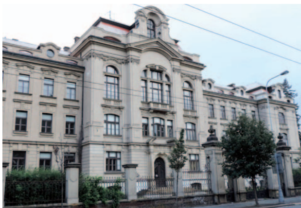
Budova bývalého Ústavu hluchoněmých

V červenci 2014 byla rovněž zahájena rekonstrukce památkově chráněného objektu bývalého Ústavu hluchoněmých v Pospíšilově ulici čp. 365 v Hradci Králové. Po dobu své více než 100leté existence budova sloužila především zdravotnickým účelům a neprošla komplexní opravou, což se projevuje v celkové zchátralosti i ve stále větších problémech při její údržbě. Komplexní rekonstrukce objektu je nezbytná i z důvodu plnění nové funkce, a to prostoru pro poskytování vzdělávacích aktivit. Tento projekt je rovněž realizován v rámci ROP NUTS II SV.