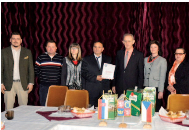
Komunitní rozvojový plán pro obce s českou menšinou v Srbsku

CIRI v roce 2014 realizovalo projekt „Komunitní rozvojový plán pro obce s českou menšinou v Srbsku“ za finanční podpory Ministerstva zahraničních věcí. Základním cílem projektu bylo zpracování rozvojových koncepcí dvou srbských sídel – Českého Sela a Kruščice.