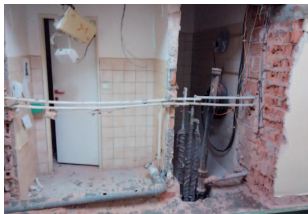
Stavební úpravy nemocnice v Rychnově nad Kněžnou

Na podzim roku 2014 byly dále zahájeny práce na zateplení Střední odborné školy a Středního odborného učiliště v Trutnově a na zateplení Ústavu sociální péče pro mentálně postiženou mládež Chotělice.