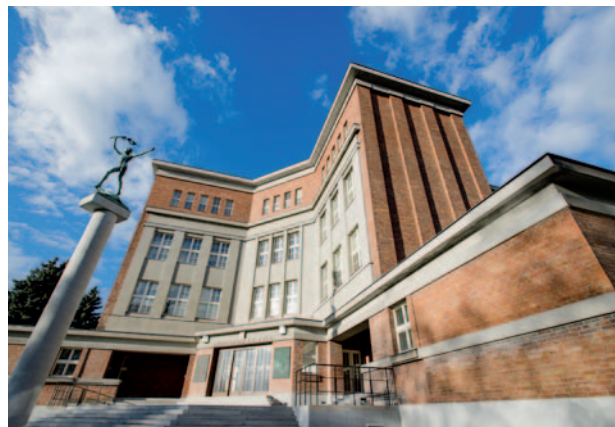
Gymnázium J. K. Tyla.

10. března 2014 došlo ke slavnostnímu otevření zrekonstruovaného objektu Gymnázia J. K. Tyla v Hradci Králové. Budovu navrhl v roce 1924 arch. profesor Josef Gočár a patří mezi nejvýznamnější stavby počátku moderní funkcionalistické architektury. Prostřednictvím šetrné regenerace byla revitalizována hlavní budova školy, přilehlá tělocvična, sousedící venkovní sportoviště a zelené odpočinkové plochy včetně oplocení.