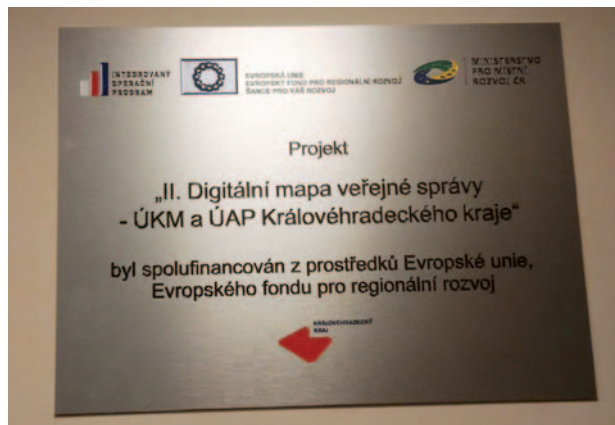
Povinná publicita projektu II. Digitální mapa veřejné správy - ÚKM a ÚAP Královéhradeckého kraje

V roce 2014 probíhala realizace projektů podporujících implementaci eGovernmentové strategie do veřejné správy. V rámci projektu II. Digitální mapa veřejné správy - ÚKM a ÚAP Královéhradeckého kraje byl v roce 2014 vytvořen portál územně analytických podkladů Královéhradeckého kraje, který obsahuje mapové kompozice k prohlížení, poskytuje služby k řízení distribuci a možnost efektivního vyhledávání na základě metadat. Byla tak zprostředkována infrastruktura pro prostorové informace umožňující efektivní správu a zajišťující dostupnost údajů o území v kontextu požadavků stavebního zákona.