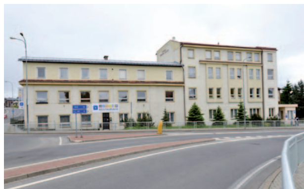
SOŠ a SOU, Trutnov, Volanovská 243

Na podzim roku 2014 byly dále zahájeny práce na zateplení Střední odborné školy a Středního odborného učiliště v Trutnově a na zateplení Ústavu sociální péče pro mentálně postiženou mládež Chotělice.