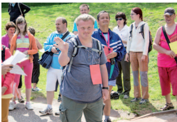
Klíenti z Barevných domků Hajnice

Transformace je změna velkokapacitní ústavní služby pro lidi s postižením na bydlení a podporu v běžném prostředí. V roce 2014 se podařilo dokončit jeden z celkového počtu pěti investičních projektů, jejichž cílem je do konce roku 2015 v Královéhradeckém kraji podpořit proces transformace sociálních služeb vybudováním (zrekonstruováním) rodinných domů v běžné komunitě tak, aby uživatelé sociálních služeb měli možnost žít v maximální možné míře život srovnatelný s životem vrstevníků.