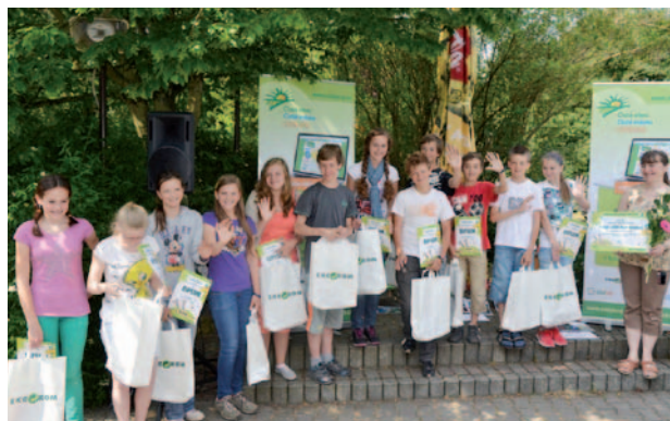
Vyhlášení výsledků soutěže škol „Třídíme s Nikitou“, VII. ročník

Projekt se zabývá zkvalitněním nakládání s odpady v Královéhradeckém kraji a podporuje správné třídění odpadů informační kampaní. Technická podpora nakládání s odpady je zajišťována nákupem nádob na třídění odpadů. Mezi cíle projektu patří i vzdělávání a osvěta zástupců obcí kraje, zároveň několik let probíhají i vzdělávací programy pro školy s tematikou třídění odpadů a realizují se mnohé další regionální komunikační aktivity, které jsou zaměřeny na problematiku třídění a recyklaci odpadů. Součástí informační kampaně jsou uveřejnění inzerátů, zpracování odborných článků, vysílání spotových kampaní v rozhlasu, pořádání soutěží pro veřejnost, organizace soutěže obcí a škol, podpora akcí pro veřejnost a další. Více informací je k dispozici na internetových stránkách projektu www.cistykraj.cz .