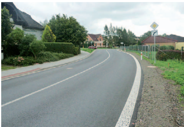
Rekonstruovaná komunikace umožní pohodlnější a bezpečnější cestování na Trase Police – Bukovice.

V roce 2014 byla zahájena realizace 13 projektů spolufinancovaná z 35. výzvy ROP SV v celkové hodnotě cca 360 mil. Kč. Dále bylo připraveno dalších 15 nových projektových žádostí do 41. výzvy ROP SV v hodnotě cca 400 mil. Kč. O úspěšnosti projektů bude poskytovatel dotace rozhodovat v roce 2015.