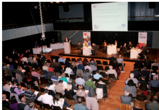
Konference Příležitosti pro města a obce 2014 – 2020

Centrum investic, rozvoje a inovací a Královéhradecký kraj uspořádaly v říjnu 2014 konferenci na téma „Příležitosti pro města a obce v období 2014 – 2020“. Konference se konala v Kongresovém centru Aldis v Hradci Králové, uskutečnila se pod záštitou 1. náměstkyně ministryně pro místní rozvoj Ing. Kláry Dostálové. Zúčastnilo se více než 250 posluchačů a diskutujících. Konference byla určena především zástupcům měst a obcí, kteří mají zájem realizovat v novém programovém období 2014 – 2020 své projektové záměry v rámci fondů EU. Zúčastnili se i další regionální aktéři - nejen ze sféry veřejné správy.