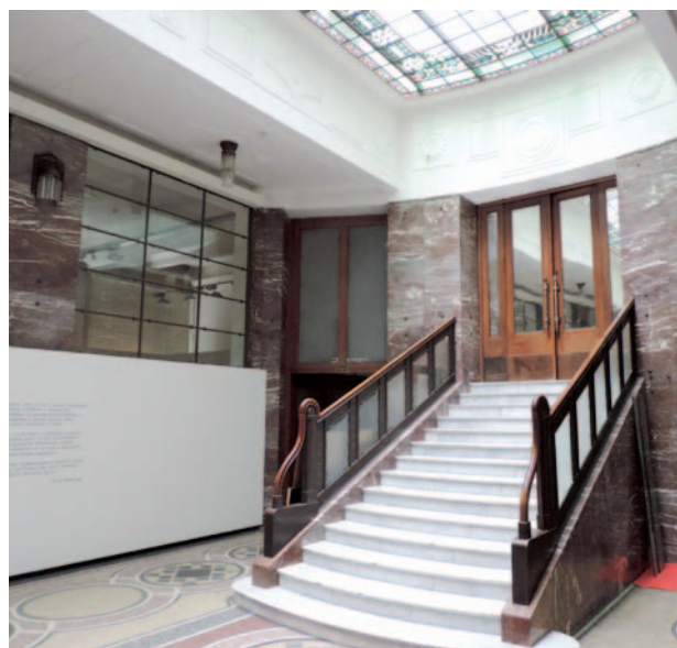
Galerie moderního umění – vstupní hala

V roce 2014 byla do ROP NUTS II SV zpracována žádost o poskytnutí dotace. Následně v červenci 2014 byly zahájeny stavební práce týkající se rekonstrukce a regenerace stávajícího objektu Galerie moderního umění v Hradci Králové. Cílem je změna prostorového uspořádání 1.NP - 5.NP, celková modernizace vnitřních částí objektu spojená se sjednocením podlahových konstrukcí, v některých částech dojde k navrácení původních konstrukcí. Bude provedena generální oprava původních fasádních výplní, oprava střech, balkónů, teras a fasády.