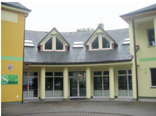
V roce 2014 byla dokončena realizace projektů zadavatele Střední potravinářské školy Smiřice.

Zahájeny byly stavební práce zateplení dvou objektů Dětského domova a základní školy v Dolním Lánově a objektu internátu v Opočně zadavatele Střední školy a základní školy Nové Město nad Metují. Minimálně 2/3 energeticky úsporných opatření byly rovněž v roce 2014 do nástupu zimního období realizovány na budově patologie v Oblastní nemoc-