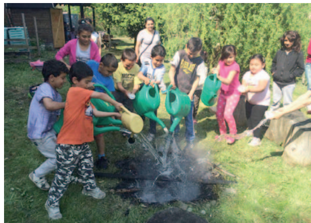
Práce s dětmi v sociálně aktivizační službě

Projekt, který reagoval na potřeby sociálně vyloučených osob zjištěné realizovaným Průzkumem potřeb obyvatel vyloučených lokalit v Královéhradeckém kraji a zohledňoval cíle a priority strategických materiálů Královéhradeckého kraje, podpořil zapojení sociálně vyloučených osob do společnosti a na trh práce. Projekt poskytl v letech 2013 – 2014 pomoc 1 875 osobám prostřednictvím podpory celé řadě poskytovatelů sociálních služeb.