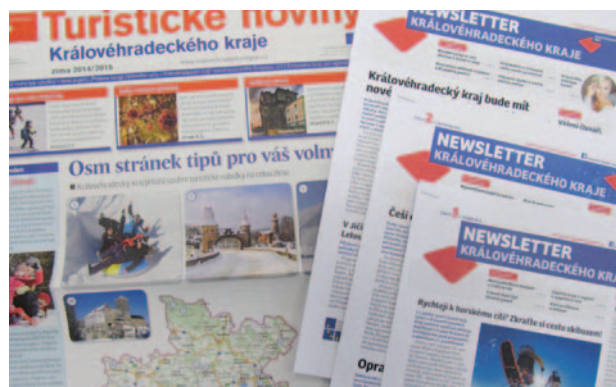
Nové produkty z projektu