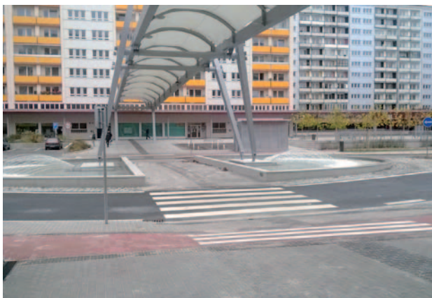
Třída Edvarda Beneše.

Rok 2014 byl v IPRM především ve znamení realizace rekonstrukce veřejného prostranství střední části této třídy včetně podzemních garáží. Dokončeno bylo i několik projektů na regeneraci bytových domů ve vymezené lokalitě. IPRM se celkově blíží k závěru realizace v roce 2015.