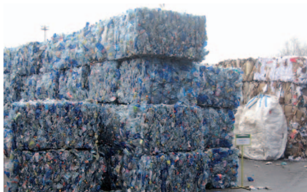
Exkurze v rámci projektu