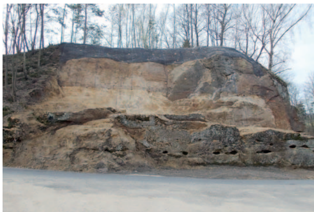
Stabilizace svahu v Rovni

Tato opatření byla realizována v celkové částce cca 36 mil. Kč a převážná část nákladů byla kryta dotací z Evropského fondu pro regionální rozvoj, konkrétně z Operačního programu Životní prostředí.