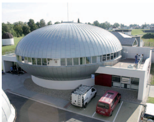
Digitální planetárium v Hradci Králové

Obsahem projektu je vybudování nového objektu digitálního planetária ve tvaru rotačního elipsoidu posazeného na široký kvádr. Objekt bude sloužit jako návštěvnické centrum pro propagaci a informovanost o výsledcích vědy a výzkumu. Srdcem projektu budou špičkový digitální projekční systém na nejvyšší technologické úrovni dnešní doby a zároveň trojrozměrná interaktivní expozice. Projekt byl podpořen z OP VaVpl.