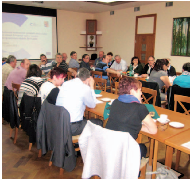
Regionální setkání zástupců obcí – obec Vrbice

vém období 2014 – 2020. Na závěr proběhla prohlídka či prezentace obce zaměřená na úspěšné projekty a aktivity v dané obci.